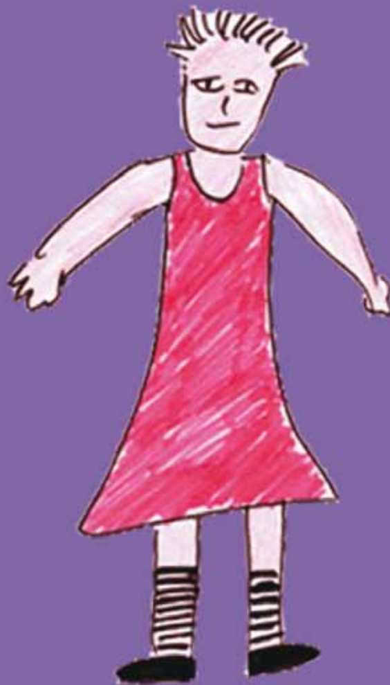
Postkarte zum Theaterstück „Prinzessin Tim“

Ein Theaterstück für Menschen ab 2 Jahren