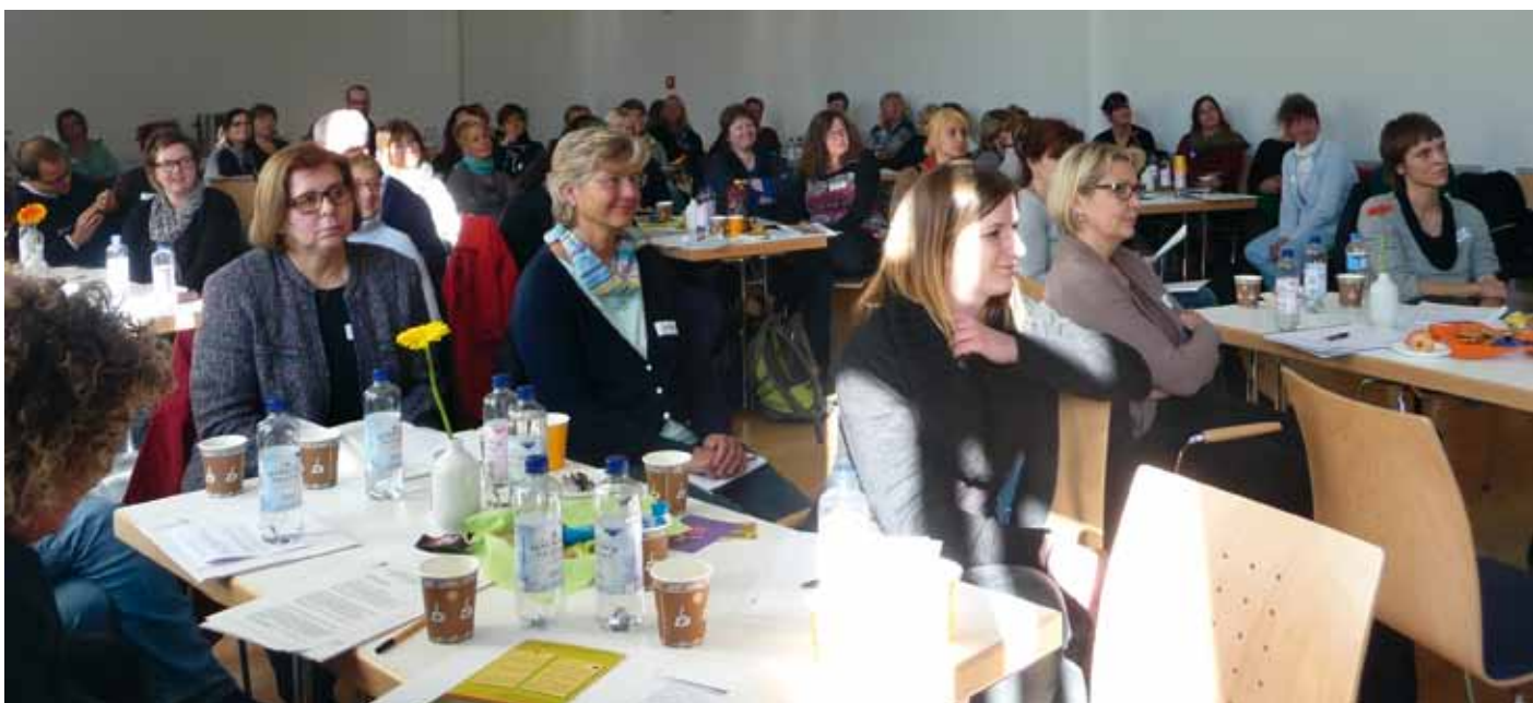
Publikum der Fachtagung