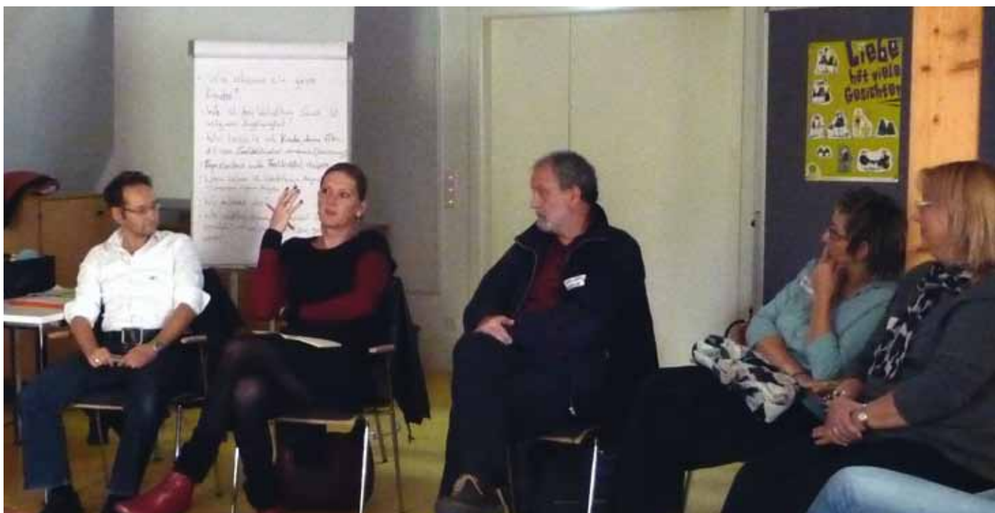
Referent_innen und Teilnehmende des Workshops 2: Zum pädagogischen Umgang mit geschlechtsvarianten Kindern

Weitere Informationen zu den Themen und Fragestellungen dieses Workshops finden Sie im Fachtext Ich bin nicht Emil, ich bin Charlotte! in der Anlage.