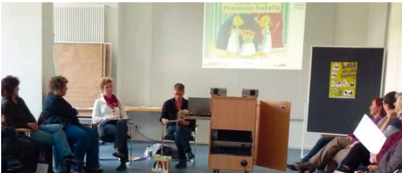
Referent_innen und Teilnehmende des Workshops 1: Vielfalt von Familien und Lebensweisen