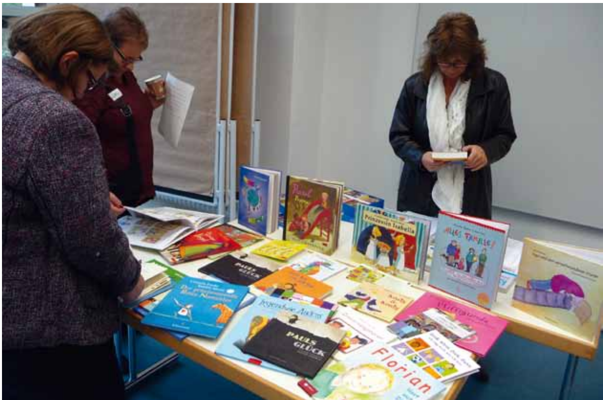
Teilnehmer_innen beim Stöbern im Medienkoffer

Selbstbestimmung, die Vermittlung von Werten und Normen und die Auseinandersetzung mit Grundfragen des menschlichen Zusammenlebens. Durch die Beschäftigung mit unterschiedlichen Familien (z. B. große, kleine, konventionelle, Patchwork-, Regenbogen, Adoptions-, Einelternfamilien mit verschiedenen Herkunftssprachen, generationenübergreifend etc.) lernen die Kinder die Vielfaltigkeit der Gesellschaft kennen. So erleben sie schon früh den sicheren und selbstverständlichen Umgang sowohl mit bekannten als auch unbekannteren Lebenswelten als Bereicherung.