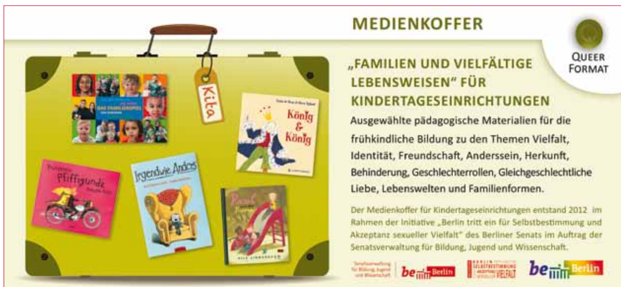
Der Medienkoffer für Kindertageseinrichtungen (Flyer)

Er ist an zahlreichen Standorten in allen Bezirken Berlins ausleihbar. Eine Liste der Standorte befindet sich auf der QUEERFORMAT website: http://www.queerformat.de/kinder-und-jugend-hilfe/publikationen-und-materialien/