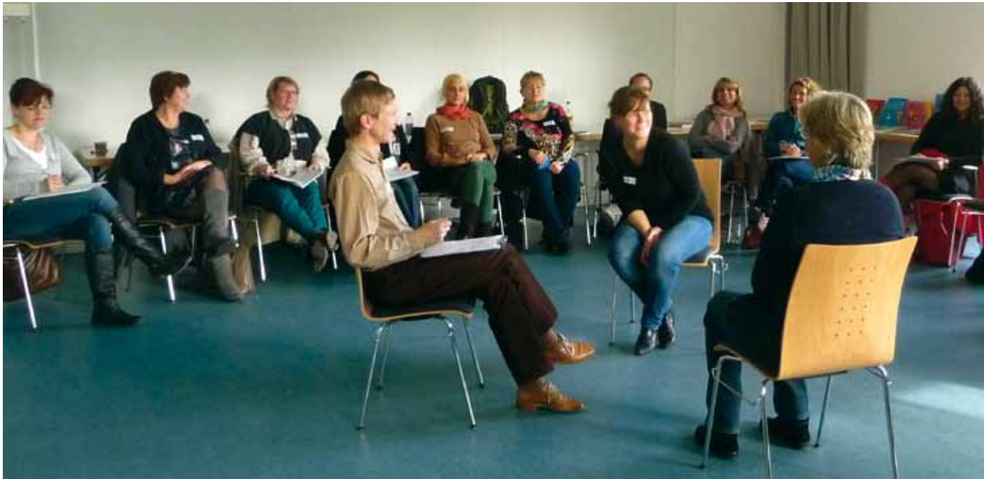
Teilnehmende des Workshops 3: Thematisierung von geschlechtlicher und sexueller Vielfalt mit Eltern